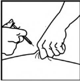
Şekil No: 3